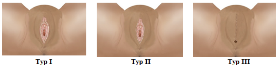
Figur 1 Tre typer av könsstympling enligt WHO:s klassificering.

WHO (2007) delar in Kvinnlig könsstympling i fyra olika typer, de har också en indelning i subtyper som går att läsa om på WHO (2007).